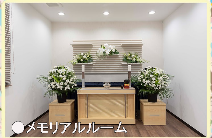
●メモリアルルーム