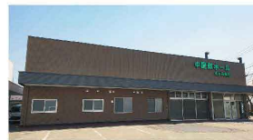
中屋敷ホール 中屋敷町1-45