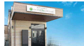
さがみ典礼の家族葬 ファミラル盛岡中央通 中央通3-5-23