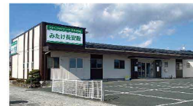
みたけ長安殿 みたけ6-1-8