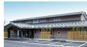
メモリアルホール 黒石野長安殿 黒石野2-5-15