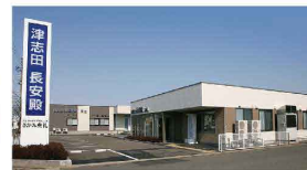
津志田長安殿 津志田町1-2-30