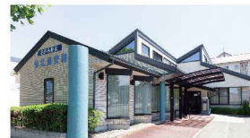
仙北長安殿 西仙北1-33-21