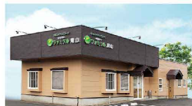
さがみ典礼の家族葬 ファミラル青山 青山2-2-12