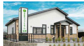
さがみ典礼の家族葬 ファミラル松園 東松園1-2-1