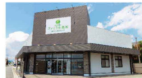
さがみ典礼の家族葬 ファミラル高松 高松1-7-17