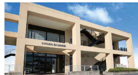
南大通長安殿 南大通2-8-3