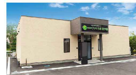
さがみ典礼の家族葬 ファミラル三ツ割 三ツ割5-1-1