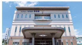
メモリアルホール もりおか長安殿 愛宕町7-8

※会員割引:会員割引の適用には当社の無料会員へのご登録が必要です(入会金・年会費・登録料等は一切かかりません)※奉仕料・料理・お供物・返礼品等は含まれておりません。プランの詳細はお問い合わせください。