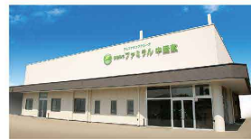
さがみ典礼の家族葬 ファミラル中屋敷 中屋敷町1-45