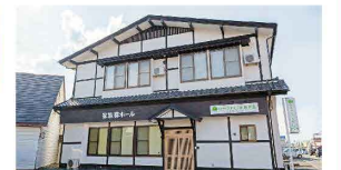
さがみ典礼の家族葬 ファミラル月が丘 青山4-44-17